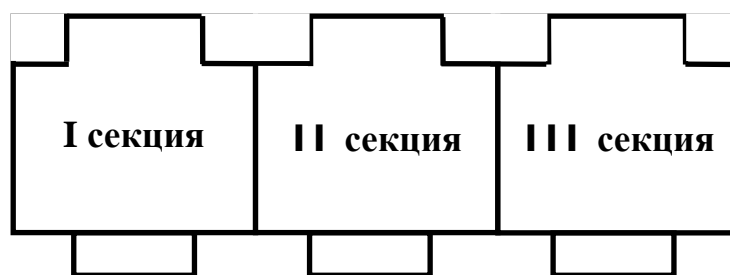
Рисунок 1 - Схема расположения объекта строительства